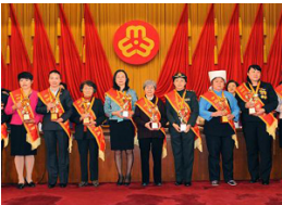
纪念“三八”国际妇女节暨全国三八红旗手(集体)表彰大会举行