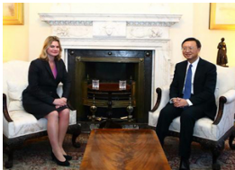
杨洁篪会见英国国际开发大臣