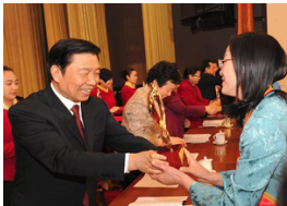
李源潮出席纪念“三八”国际妇女节暨全国三八红旗手表彰大会并讲话